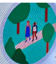
Viktige mennesker for meg