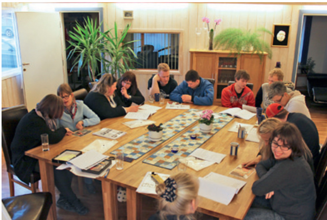
Ungdomsgruppen i arbeid med oppgaver.

av kursdagen. Først repeterer vi hva vi jobbet med forrige kursdag. Dette bruker vi gjerne halvparten av første økt på. Deretter begynner vi på dagens tema frem til første pause.