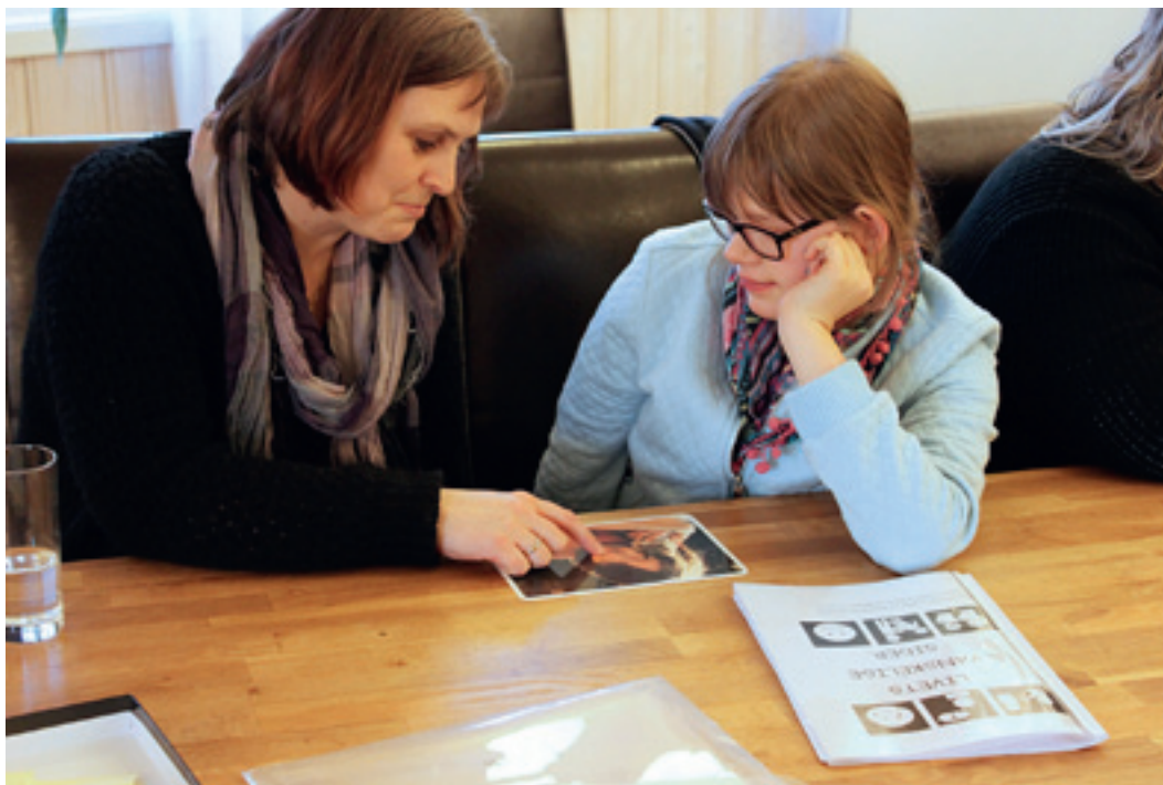
Ledsager og kursdeltagere samarbeider om å tolke hvilke følelser personen på bildet viser.