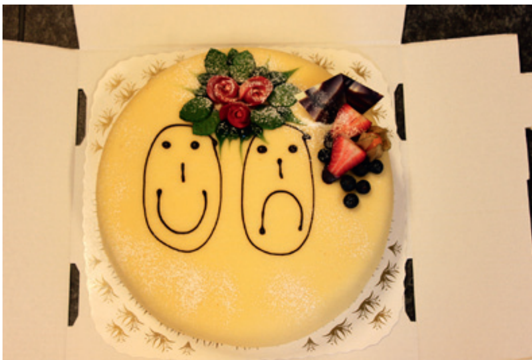
Alltid kake på siste kurskveld.

kurs. Vi har også tilstrebet at det bør være tilnærmet lik kognitiv forståelse i gruppen. Det har vært utfordrende å sette sammen gruppene.