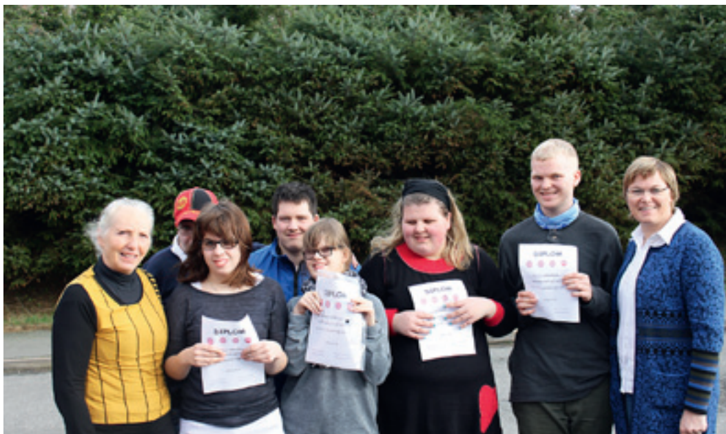
Kursdeltagerne er stolt av diplomene de fikk etter gjennomført kurs.

Alle som til nå har deltatt på kurs hos oss, er blir kontaktet og invitert til å delta. Gjennom vårt arbeid i kommunen, kommer vi i kontakt med mange som kunne ha nytte av kurset. Vi har tenkt at den enkeltes livssituasjon og behov for kurs er viktig. Deretter har vi tenkt at gruppene ikke må være for store. Vi har valgt 5-6 personer pluss ledsagere. I situasjoner hvor det har vært sykdom i gruppen har vi sett at det kan bli sårbart for de tilstedeværende. Vi har tenkt at det kan føles vanskelig med for mye oppmerksomhet. Tilbakemeldingene har derimot vært at kursdeltakerne har følt seg sett og hørt. Begge kjønn har vært representert på våre