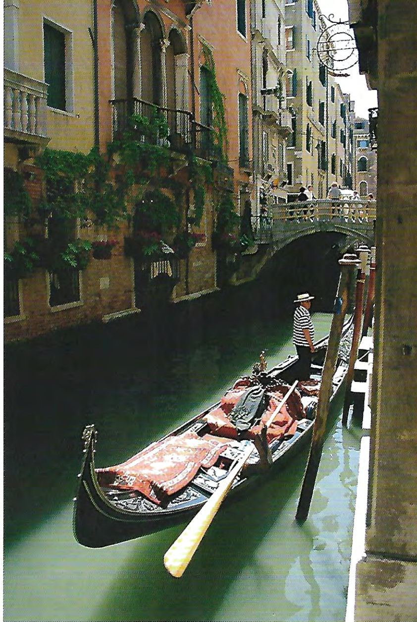
Illustrasjonsfoto Erling Markeng.