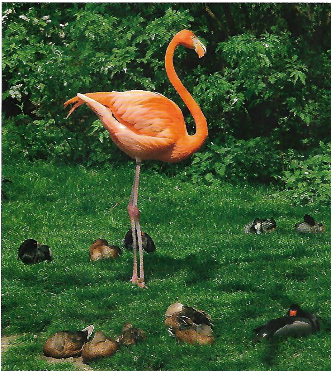
Illustrasjonsfoto Erling Markeng.

glemt alt annet, synes jeg. Hva skal man fylle livet sitt med?»