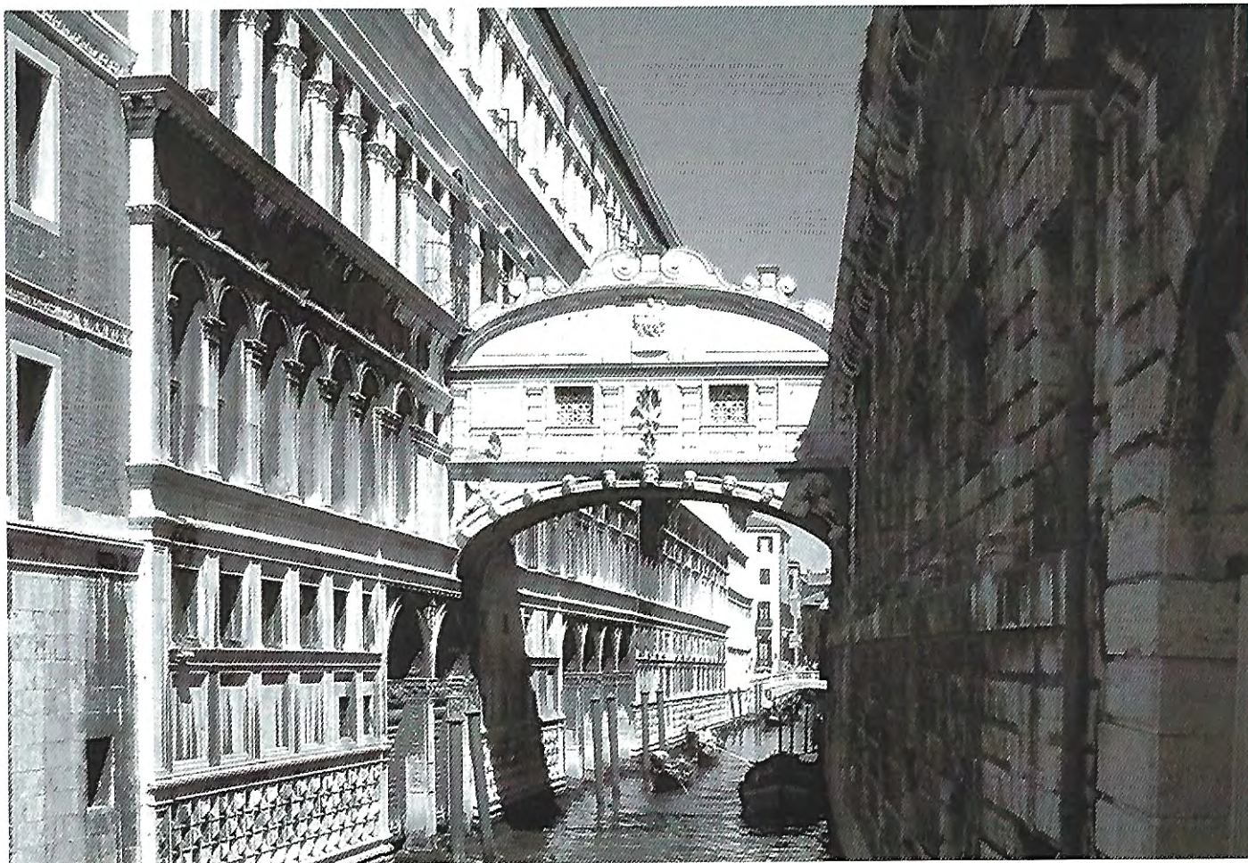
«Sukkenes bro».