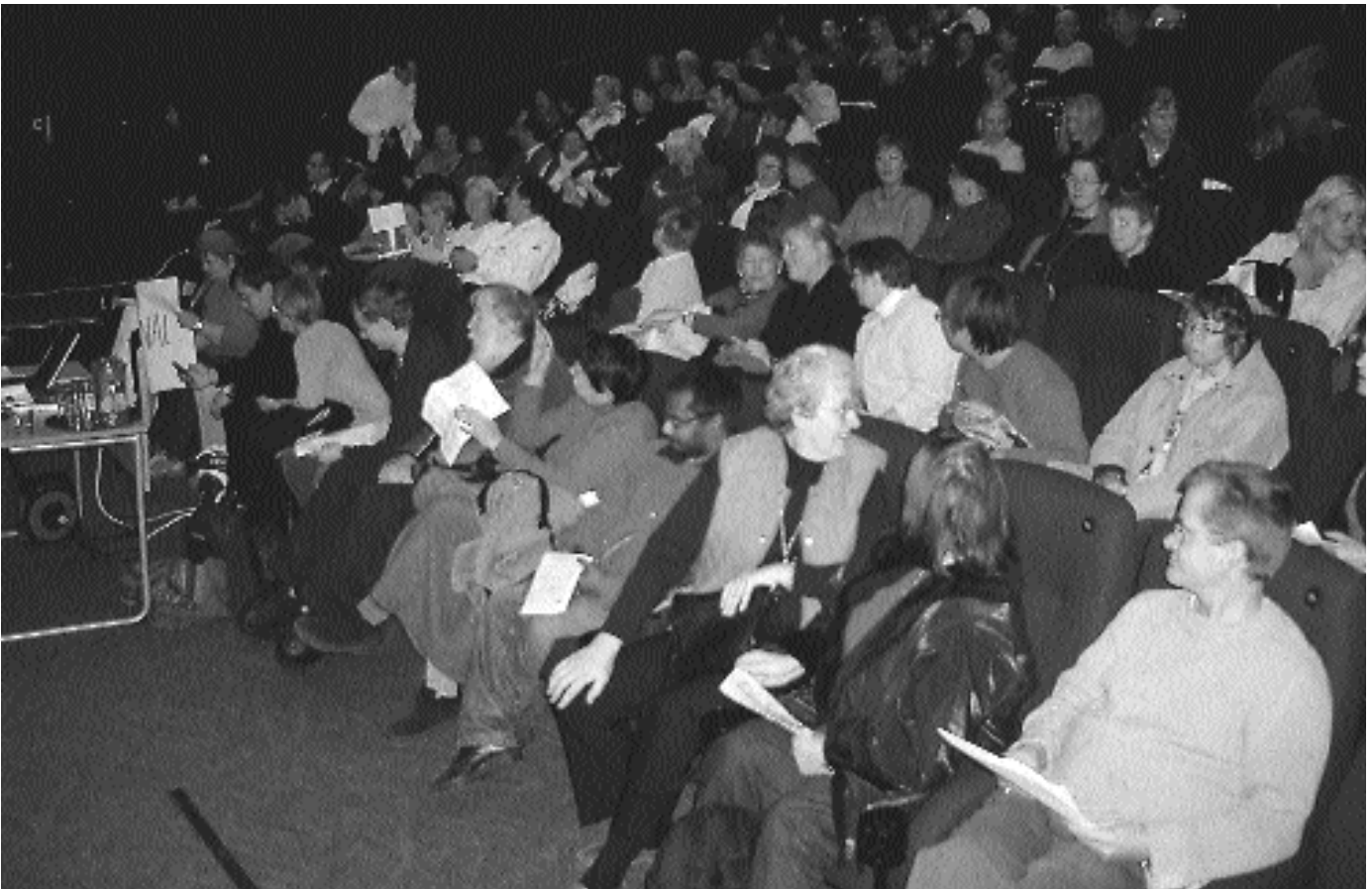
Fra Rådgivningsgruppen i Bærums konferanse om selvbestemmelse.

istället för på anstalter. Utflyttningen från anstalterna började med barn och ungdomar och fortsatte sedan med de vuxna. 1985 beslöt riksdagen om intagningsförbud och 1997 att de anstalter som finns kvar ska vara stängda år 2000. Under 70-talet myndigförklarades upp emot tiotusen utvecklingsstörda och de fick rätt att rösta. Lättlästa böcker framställdes och från mitten 80-talet ges en lättläst dagstidning ut en gång i veckan.