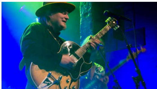
Konsert med Knut Reiersrud